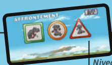
Niveaux de difficulté

Essayez de terminer tous les défis pour découvrir de nouveaux modes de jeu et de nouveaux niveaux de difficulté.