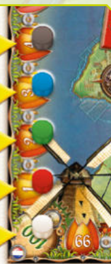
Position de départ des joueurs